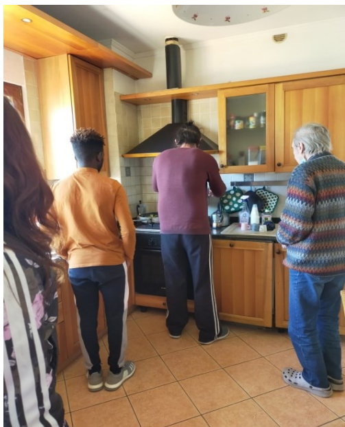
Esperimenti in cucina!!!!!!