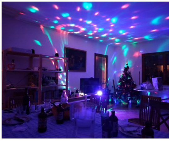
Aspettando il 2021!!!!

Presenze al 31/12/2021: 10 persone, 5 residenti e 5 diurni, con problematiche inerenti la salute mentale.